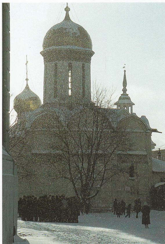
Credincioși intrând pentru slujbă în Mănăstirea Sfânta Treime – Sfântul Serghie, Zakhariev-Posad (Zagorsk, înainte de 1991), în Rusia. Mănăstirea, care adăpostește numeroase comori istorice și artistice, în special moaștele Sfântului Serghie, protectorul Rusiei, este foarte frecventată de locuitorii Moscovei.

În realitate, e vorba despre două sensibilități globale, care au fost complementare în primul mileniu și ar putea redeveni astfel. Ceea ce poate se va întâmpla în viitorul creștinismului.